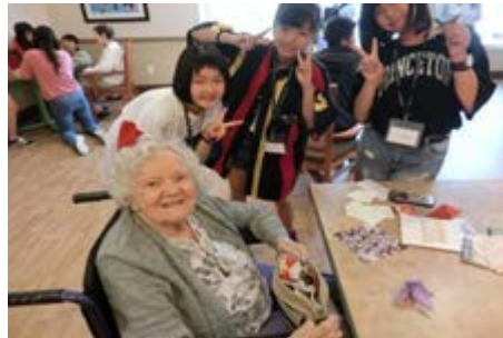
シニアセンターにて