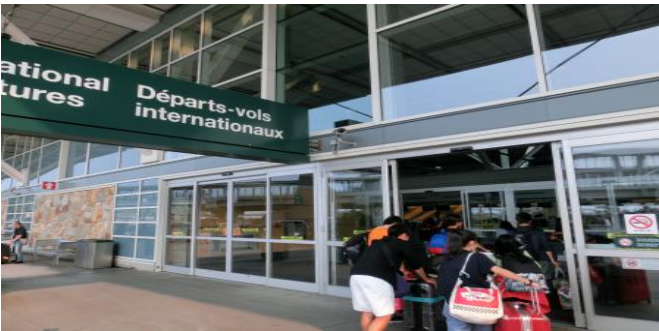
バンクーバー空港にて

(AM) 専用バスにてバンクーバー市内へ (PM) バンクーバー空港出発 機中泊