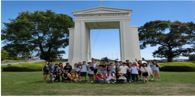
ピースアーチにて