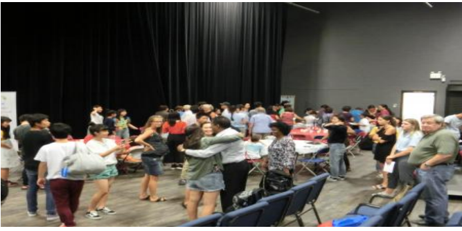
フェアウェルパーティーにて