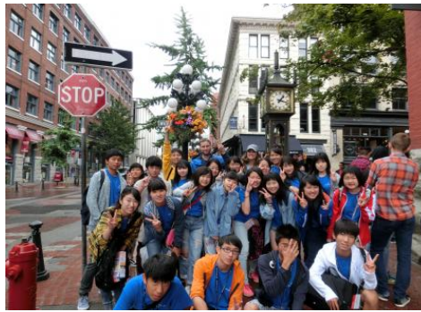
ダウンタウン 蒸気時計前にて