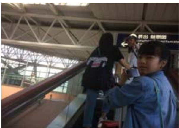
関西国際空港にて

関西国際空港発 AC1952 便 バンクーバー着 サレー・クリスチャン高校到着 ホストファミリー宅へ