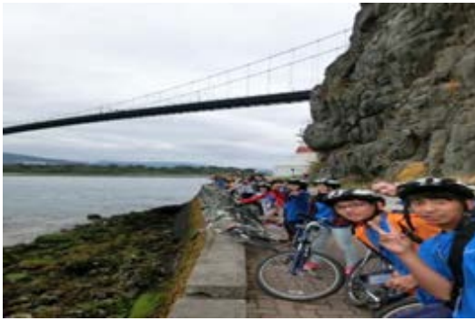
スタンレーパークにて