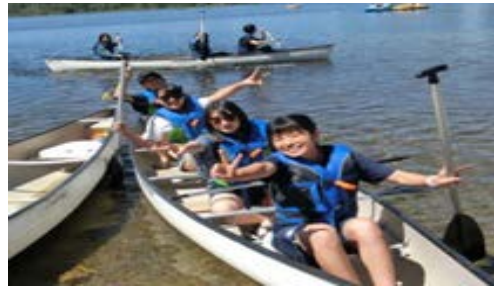
ディアレイク・カヤック体験にて